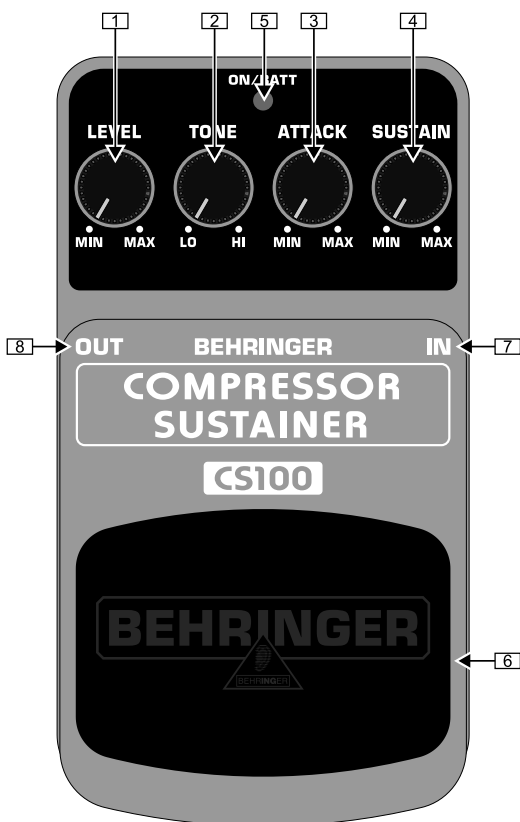
Vista lato superiore